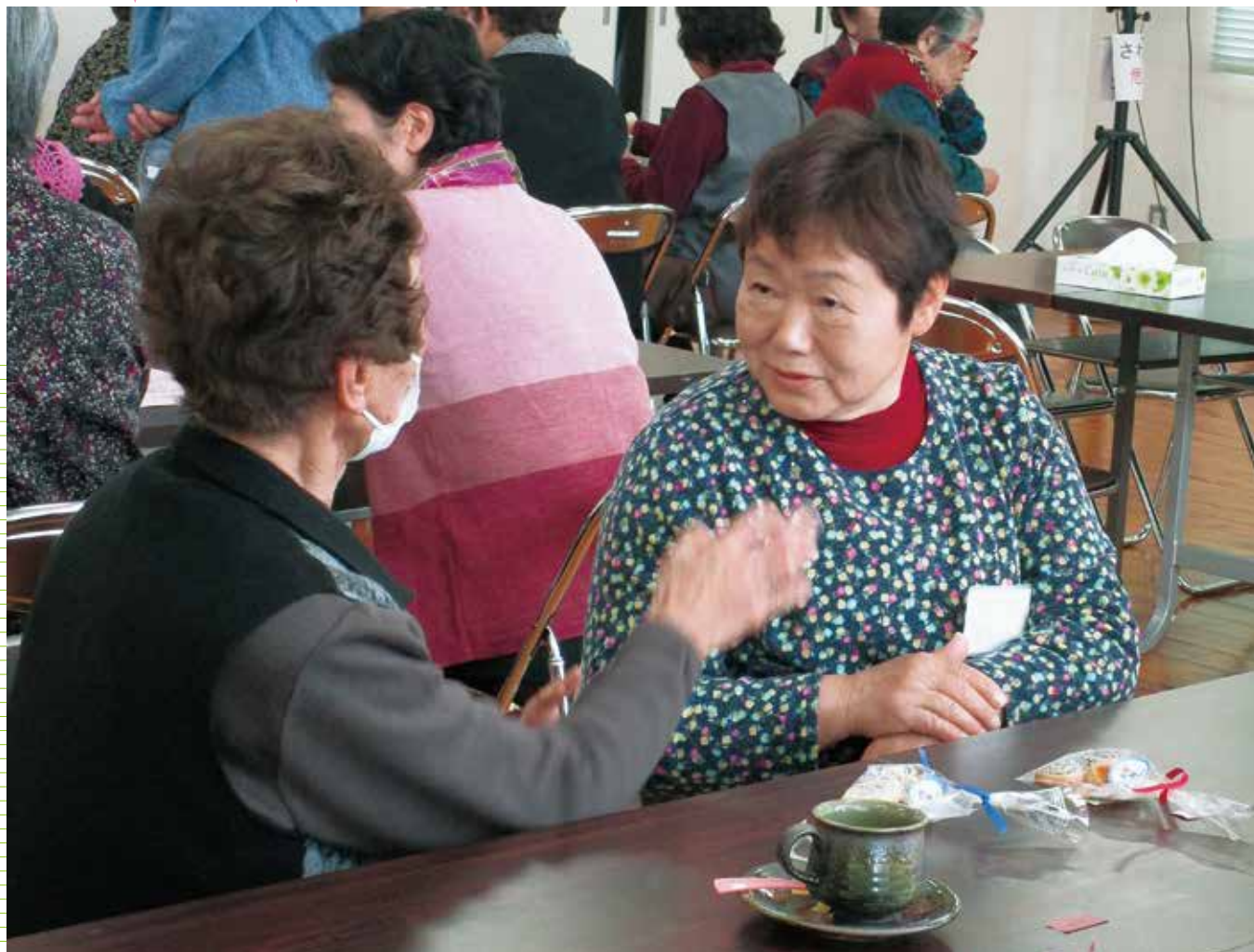
虹色カフェオープン! おいしいコーヒーとクッキーをお供に話の花が咲きました