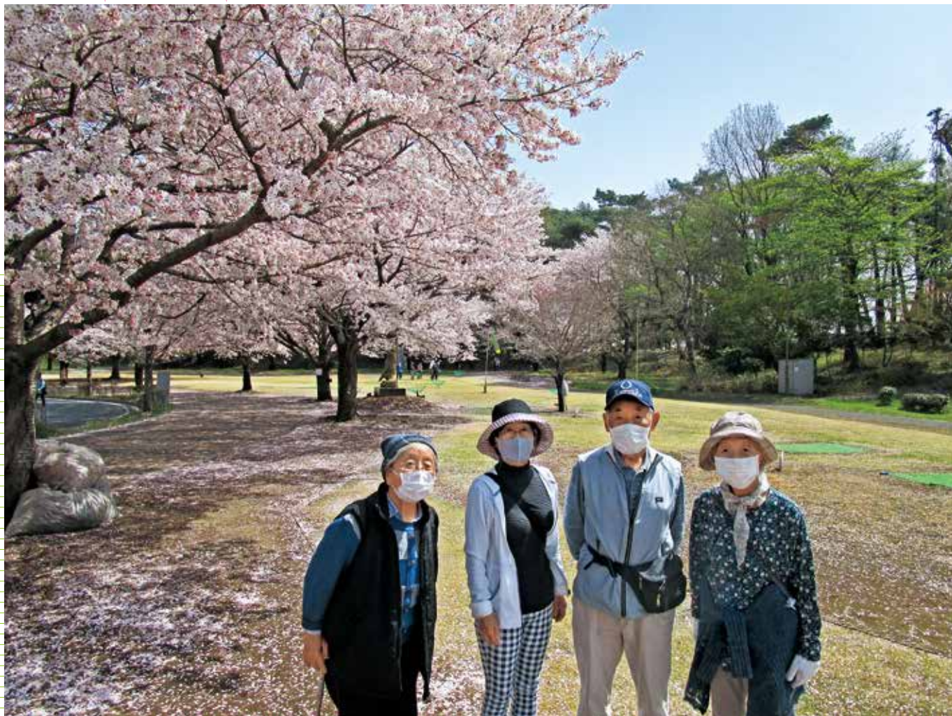
老人クラブ春のウォーキングのひとつ 今年はきれいな桜の下で写真を撮れたことに感謝（館林某所）