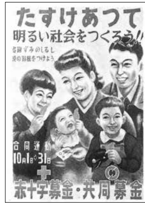
▶昭和22年当初のポスター

共同募金運動は、第二次世界大戦後、1947年(昭和22年)に「国民たすけあい運動」として始まりました。「困った時はお互いさま」の気持ちから、第1回目の募金運動ではおよそ6億円の寄附金が寄せられました。現在の貨幣価値にすると1,200億円に相当すると言われています。