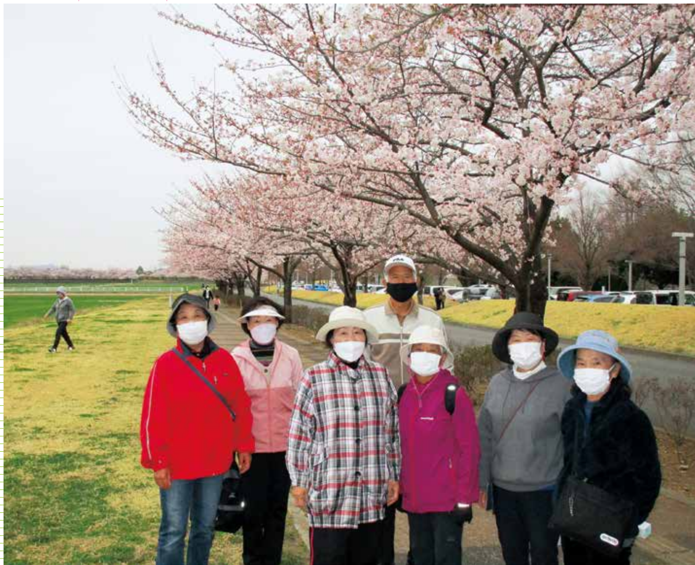
今年もひっそりお花見できました（館林某所・老人クラブ春のウォーキング大会）