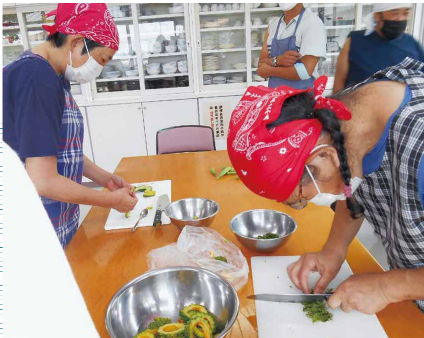
町地域活動支援センターの庭で始めた野菜作り。収穫したお野菜を使っでの調理実習はひと味違います。