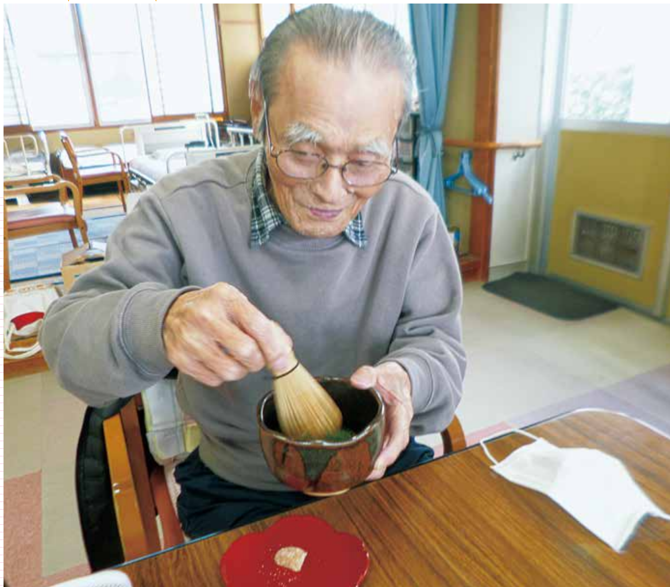
新春お点茶。けっこうなお点前で。(町デイサービスセンター)