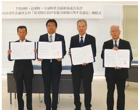
千代田町・邑楽町・大泉町社会福祉協議会及びおおらか青年会議所との「災害時における協力度体制に関する協定」締結式

災害時に社会福祉協議会が設置・運営する災害ボランティアセンターに対し、おおらか青年会議所（大泉町、邑楽町、千代田町の20代～40代の指導者となりうる人たちが属する団体）が被災者救済に関する人材や器具等の迅速な協力度体制整備すること、また平時から連携を図ることを確認し、協定を結びました。